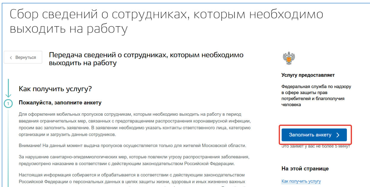
Рисунок 2 – Кнопка «Заполнить анкету»

После успешной авторизации необходимо нажать кнопку «Заполнить анкету» (рисунок 2).